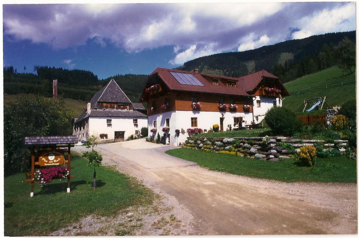
umgebaut im Jahre 1998